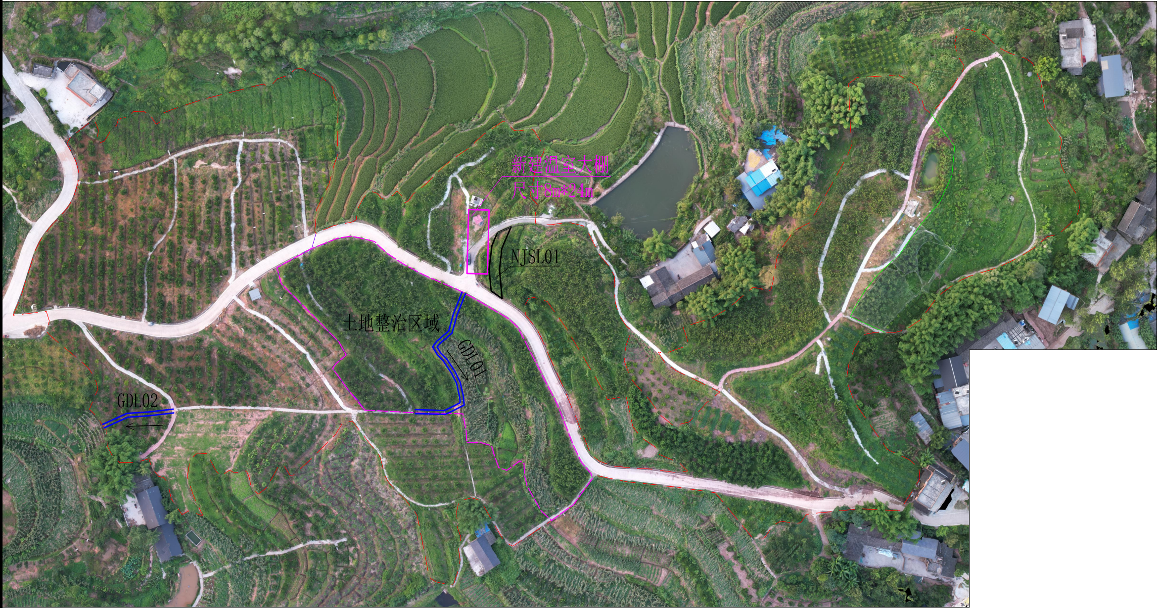
璧山区福禄镇果然美果园提升整治项目平面示意图1